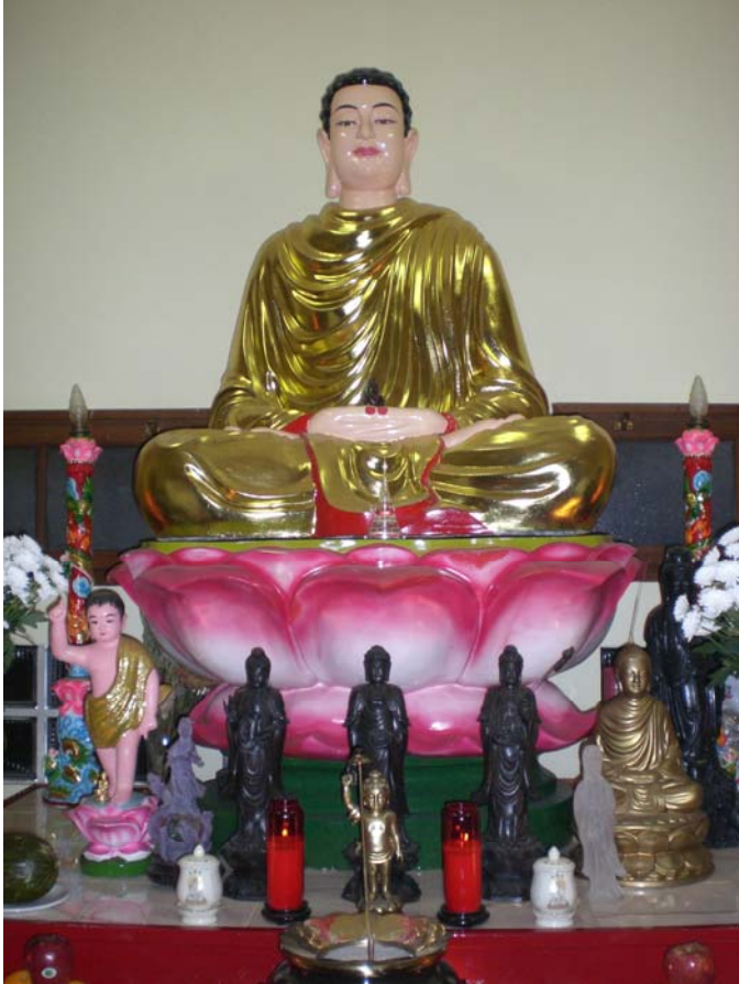
NAM MÔ BỔN SƯ THÍCH CA MÂU NI PHẬT