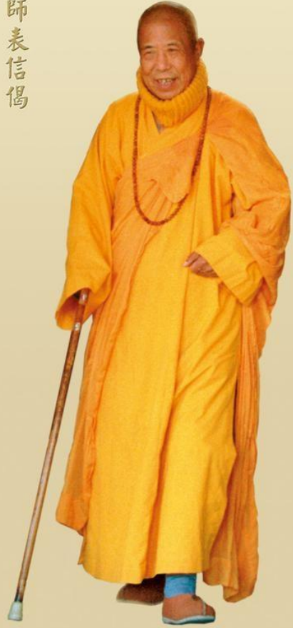
Hòa thượng Tuyên Hóa